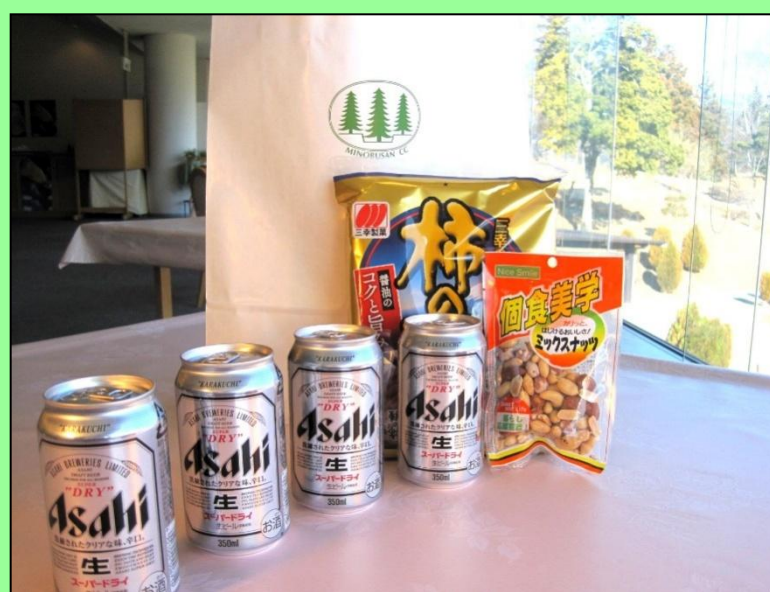
OYS(大人よろこぶ)セット

※内容は時期により変更になる場合がございます。 ※人数が当日8名様以下になった場合(無料券利用含む)、特典は付きません。 ※OYSセットはお電話、自社WEB限定です。